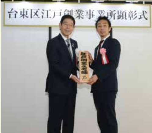
顕彰式 記念品授与(有職組紐道明)

平成30年は、江戸から明治へと時代が変わり150年の節目の年です。台東区は、江戸以来の産業や文化が大いに発展し、江戸の技、江戸の粋を有する江戸時代に創業した事業所が多数所在しています。本年を「江戸ルネサンス元年」と位置付け、江戸の優れた面を改めて認識し、本区のより一層の飛躍を図るため、台東区が有する魅力ある地域資源を発信していきます。江戸創業事業所顕彰では、江戸時代に創業し、永年に渡って区内産業に貢献のある事業所を顕彰し、世界に誇れる「宝物」として、広く国内外に情報発信をし、台東区の魅力倍増ひいては効果的なインバウンドの誘致、受入の充実を目指していきます。