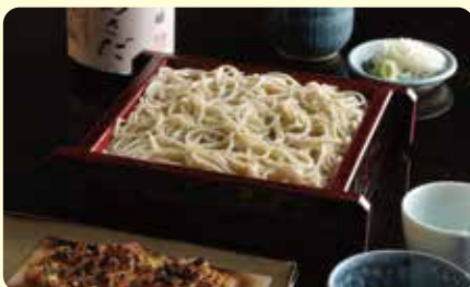
江戸蕎麦手打處あさだ