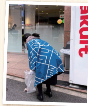
東京ヤクルト販売株式会社様