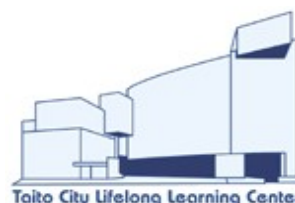
Taito City Lifelong Learning Center