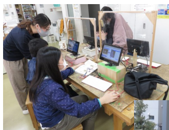
プログラミング学習