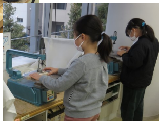
糸のご盤にも挑戦!