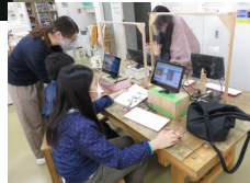
プログラミング学習