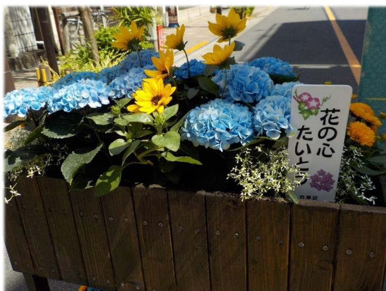
イベント時の緑化の様子（令和元年度お富士さんの植木市）