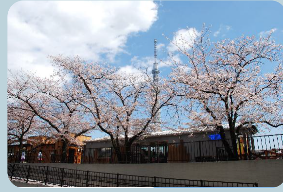
隅田公園オープンカフェ