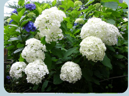
アジサイの見所 ～アナベル～