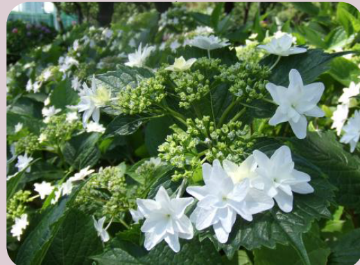
アジサイの見所 ～スミダノハナビ～