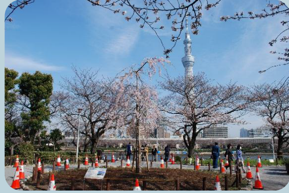
千年桜 (三春滝桜 子孫木) 種類: ベニシダレ