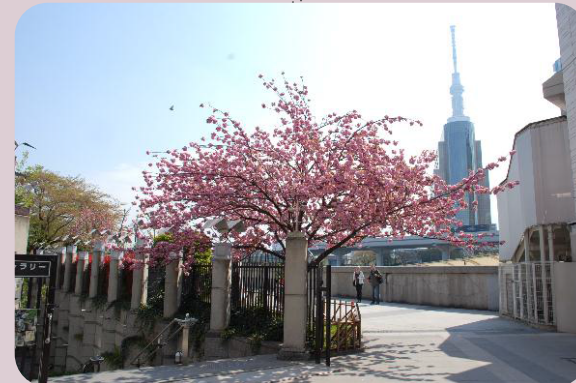
リバーサイドギャラリー入口