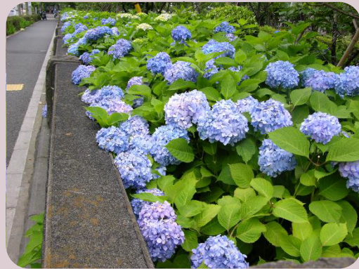
アジサイの見所 ～ホンアジサイ～