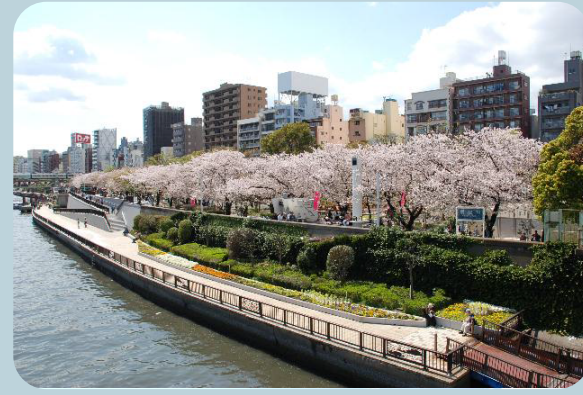
言問橋から見えるサクラ並木