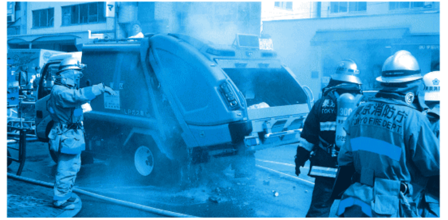
台東区内で発生した清掃車火災

中身が残ったスプレー缶やカセット式ガスボンベなどをそのまま「燃やさないごみ」に出すと、清掃車火災の原因となり、大変危険です。