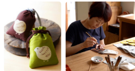
ひとつひとつ、丁寧に型染めを行っています

行い、少しずつ今の形になっています。浅草にほど近い立地でありながら、普段はとても静かな北部エリア。落ち着いて制作に集中したり、子育てをするには最適の環境です。地元の人たちもとても優しく、暮らしやすいと感じています。