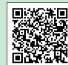
ワクチン最新情報

新型コロナウイルスワクチンに関する区の最新情報は、右記二次元コードよりご確認ください。