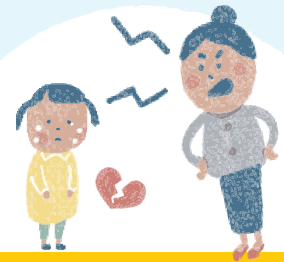
産まれてきたこと を否定 ひ てい される

どんなに大好きな相手でも、こんなことをされたら、痛くて、悲しくて、つらいですよね。 でも、大人も悩んだり、怒ったり、いやなことがあって落ち込んだりすることもあります。 だからといって子どもに体罰などをあたえることは、ゆるされることではありません。 あなた自身やお友達が「体罰や暴言を受けているかも？」と思ったら、 信頼できる大人の人に相談してみよう。 あなたの力になりたいと思っている人は、たくさんいるよ。