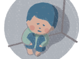
どこかに とじこめられる