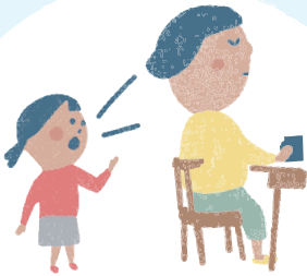
無視 む し される