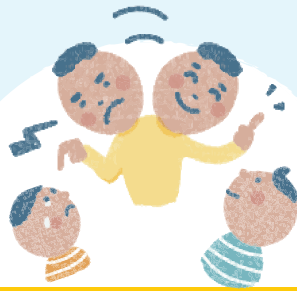
きょうだいと 比べてけなす