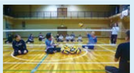
シットイングバレーボール体験会