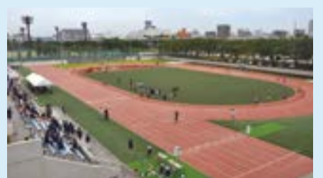
台東リバーサイドスポーツセンター陸上競技場