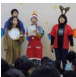
じどうかんまつりの司会