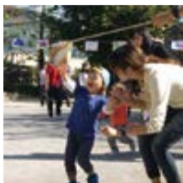
幼児タイム・運動会

子育て世代の、育児の情報交換や地域での仲間づくりができるきっかけをつくり、児童館が子育て家庭にとっての居場所となるよう支援しています。また、0～3歳児の乳幼児親子を対象に、体操やふれあい遊びを通して交流が出来る事業、『幼児タイム』を行っています。