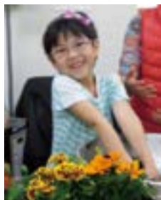
「花の心 たいとう宣言」児童館での栽培活動