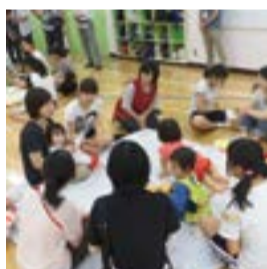
乳幼児と高校生のふれあい体験