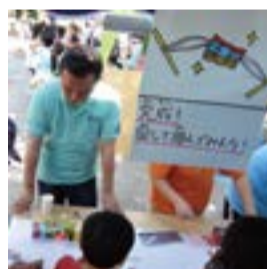
下町こどもまつり