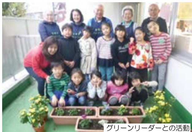
グリーンリーダーとの活動