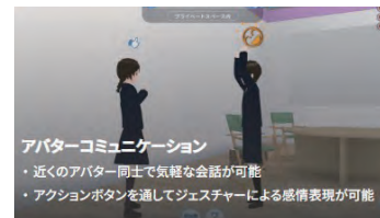
仮想空間のイメージ

今後、あしたば学級に在籍していない児童・生徒でも、1週間に一度も学校に登校できていない状態にある家庭に対して利用を拡大していく予定です。利用に当たっては、学校もしくは教育支援館に直接ご相談ください。