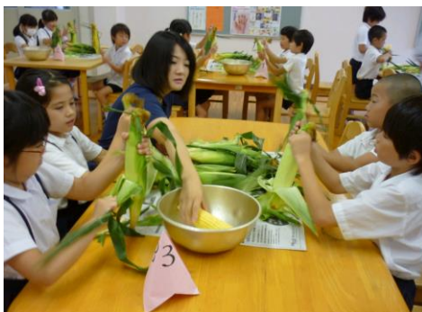
とうもろこしの皮むき体験