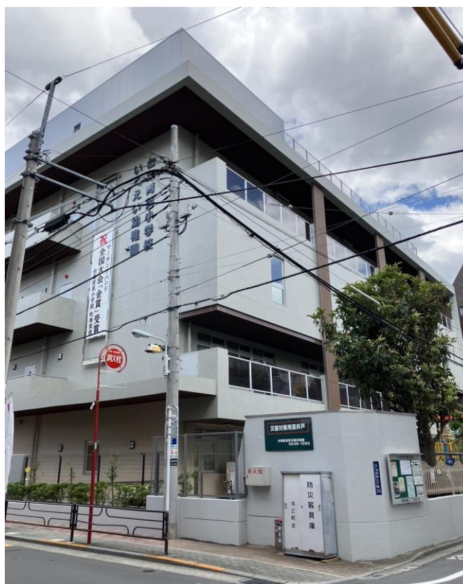
台東育英小学校 外観