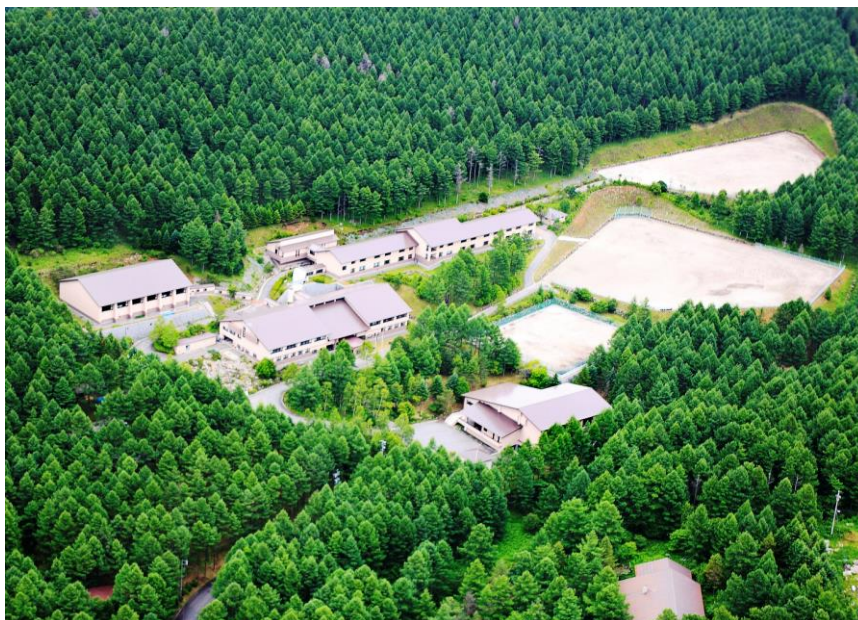
少年自然の家霧ヶ峰学園