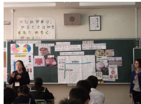
バランスのよい食事についての学習