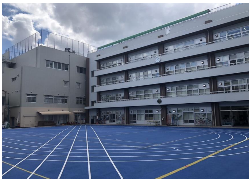
台東育英小学校 校庭

区では、平成27年度から「台東区公共施設保全計画」に基づき、学校施設の長寿命化を図るため、順次老朽化した学校の改修工事を行っている。令和5年度には台東育英学校・育英幼稚園の大規模改修が終了した。