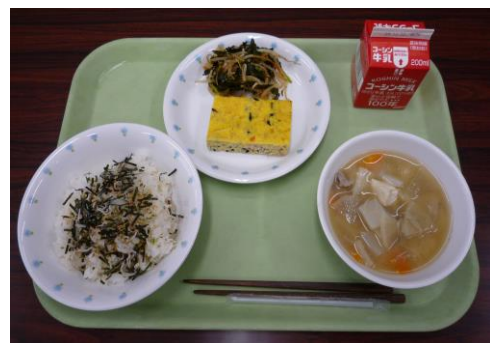
ご飯、手作り海苔ふりかけ、卵焼き ごま和え、とん汁、牛乳