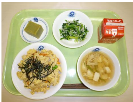
親子丼、じゃこと小松菜炒め、すまし汁、芋ようかん、牛乳