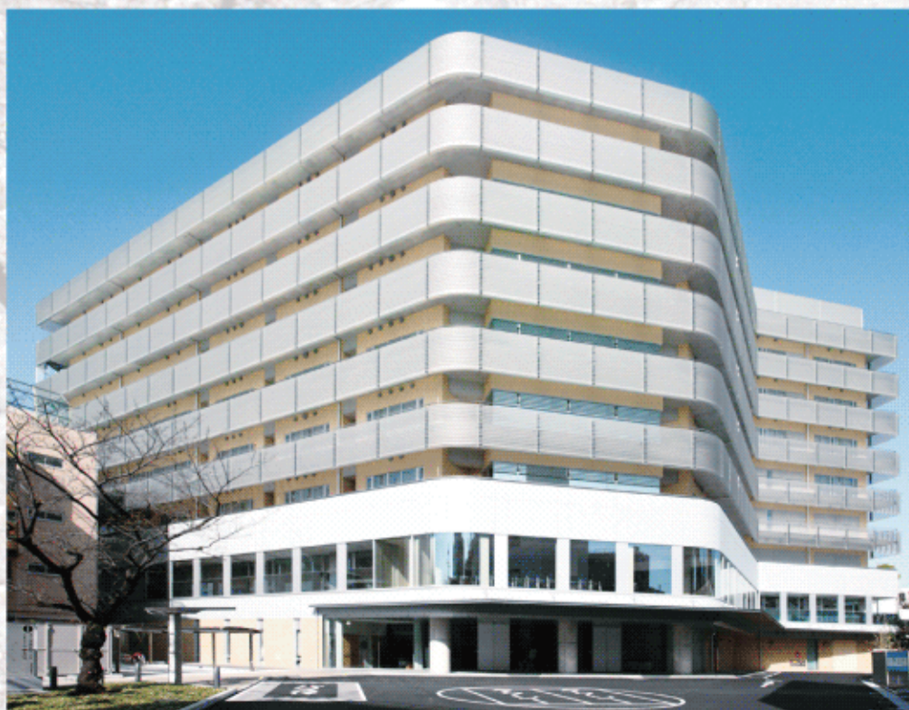
区立台東病院・老人保健施設千束（台東区千束3丁目20番5号）