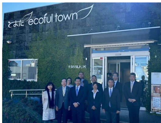
とよたエコフルタウンにて