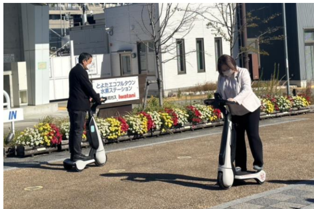
「C+w a l k」試乗体験の様子