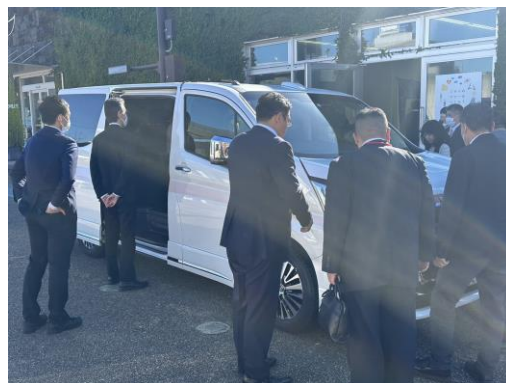
「FCオフィスカー」見学の様子