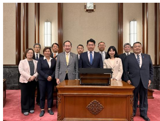
名古屋市会 議場にて