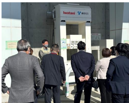
とよたエコフルタウン 視察の様子

本区においては、令和4年2月に、2050年までにCO 2 排出量を実質ゼロとする「ゼロカーボンシティ」を目指すことを宣言しており、環境に負荷をかけない持続可能な社会を構築していくための取組を推進している。また、国内外から多くの観光客が訪れる観光地であることや少子高齢化が進んでいることから、交通に対するニーズが高まっており、更なる交通利便性の向上に向けて取り組んでいる。このような方向性を踏まえ、グリーンスローモビリティの導入に向けた実証実験を実施するなど、新たな交通手段の検討を進めているが、今後の検討にあたり、豊田市における先進モビリティの活用事例は、環境負荷の低減と交通利便性の向上を両立する先進的な取組として大変参考になった。