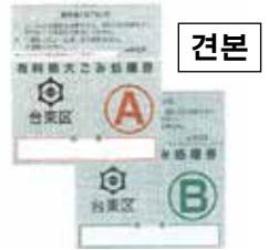
대형 쓰레기 처리권을 구입하여 부착합니다

●대형 쓰레기 접수 센터 ☎ 03-5296-7000(월요일부터 토요일 오전 8시부터 오전 7시) 인터넷 https://sodai.tokyokankyo.or.jp/