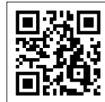
이곳을 통해서도 접속할 수 있습니다.

【문의】 쓰레기는 타이토 청소 사무소 ☎ 03-3876-5771 자원은 청소재활용과 ☎ 03-5246-1291