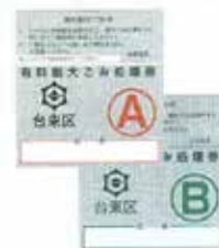
购买大件垃圾处理券黏贴