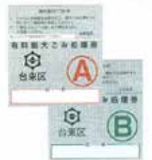
대형 쓰레기 처리권을 구입하여 부착합니다