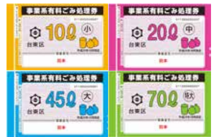
타이토구 사업계 유료 쓰레기 처리권