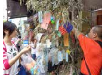
일본어 교실의 질서 체험 모습

【홈페이지】 http://www.city.taito.lg.jp/index/kurashi/foreigner/index.html