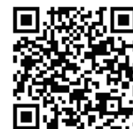
継続持込管理システム

右の二次元コードから継続持込管理システムにアクセスすることでメールアドレスを登録できます。システムに関する詳細は、電話（03-6238-0829）でお問い合わせください。