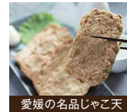
愛媛の名品じゃこ天