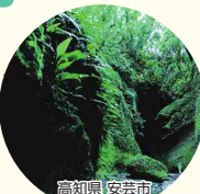
高知県安芸市 神秘的洞窟 伊尾木洞