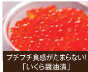
プチプチ食感がたまらない! 「いくら醤油漬」

函館市は、函館山からの夜景や五稜郭、さらには歴史的な景観などが有名な都市で、全国自治体魅力度調査で毎年上位に選ばれています。