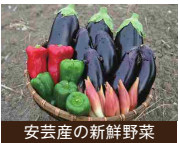
安芸産の新鮮野菜