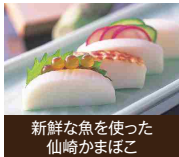
新鮮な魚を使った仙崎かまぼこ