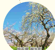
青森県越生町 関東三大梅林の一つ「越生梅林」