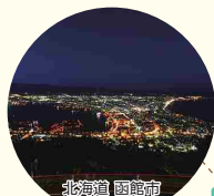
北海道函館市 ミシュランで三ツ星! 「函館山からの眺望」