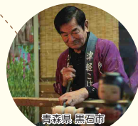
青森県黒石市 伝統の技!津軽系こけし