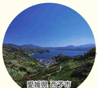
愛媛県西予市 宇和海狩浜の段畑と農漁村景観