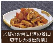
ご飯のお供に! 酒の肴に! 「切干し大根松前漬」