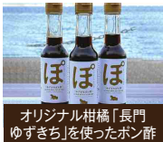
オリジナル柑橘「長門ゆずざち」を使ったボン酢