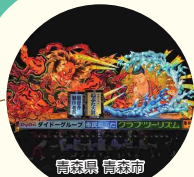
青森県青森市 青森ねぶた祭