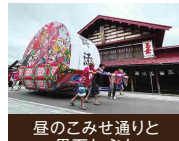
屋のごみせ通りと黒石ねぶた