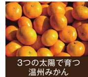
3つの太陽で育つ温州みかん