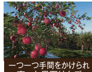
一つ一つ手間をかけられ育った黒石りんご