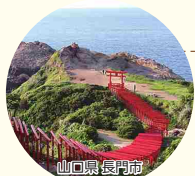
山口県長門市 CNN「日本の最も美しい場所31選」に選ばれた「元乃隅神社」

全国各地の自治体が1週間単位で入れ替わり、各地の魅力を発信する新しい形のアンテナショップです。毎週新鮮で珍しい特産品が揃い、懐かしいふるさとの魅力に出会えます。