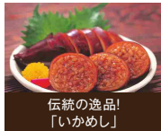
伝統の逸品! 「いかめし」