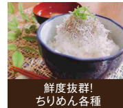
鮮度抜群! ちりめん各種