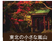
東北の小さな嵐山「中野もみじ山」

青森県の真ん中に位置する黒石市は、八甲田山麓の自然豊かなまちです。四季がはっきりと感じられ、種類豊富な温泉や藩政時代の情緒あふれる歴史的街並みを楽しむことができます。