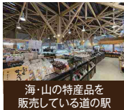
海・山の特産品を販売している道の駅