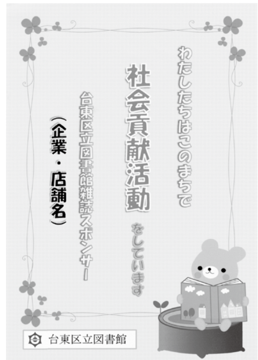
(社会貢献活動PR用掲示物)