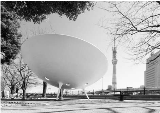
「グリーンプラネット」 隅田公園東武鉄橋南地区

3年計画の最初の年であった平成22年度は、隅田公園内に2つのアート作品「グリーンプラネット」と「LOOK」を設置しました。また、秋に開催した隅田川 Art Bridge2010展では、台東区・墨田区で合計16個のアートプロジェクトを実施し、49,759人が参加しました。