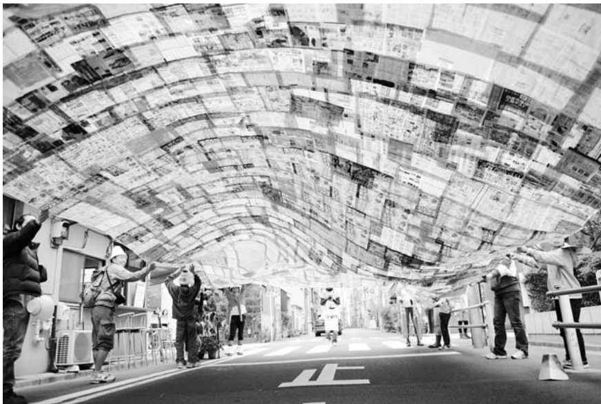
隅田川 Art Bridge 展2010の様子

東京スカイツリーと浅草を結ぶ地域に複数のアートエリアを設け、絵画展、現代美術展、映像展、音楽コンサート、シンポジウムなどのアートイベントを開催します。