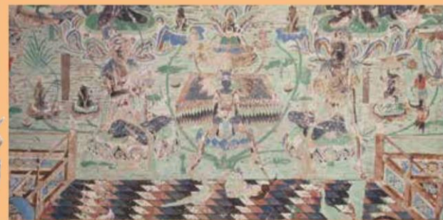
國司華子「敦煌莫高窟壁画第220窟 南壁 阿弥陀浄土变相部分(初唐)」