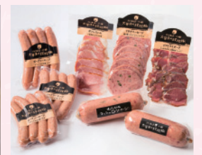
放牧豚ソーセージ