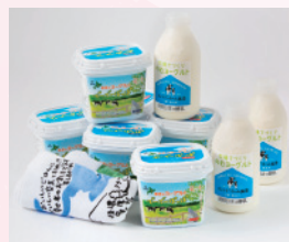
牧場でつくりヨーグルト