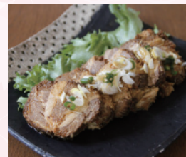
大人気! とろけるチャーシュー