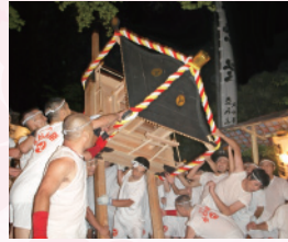
天下の奇祭宮田村祇園祭 暴れ神輿