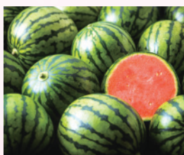
夏を先取り! こだますいか

日本百名山のひとつ筑波山の西側に位置し、風光明媚で豊かな自然環境に抱かれた茨城県西部の都市です。今年も甘くておいしい「こだますいか」の季節がやってきました!日本一の産地である筑西市の初夏の味をぜひお試しください☆お待ちしております。