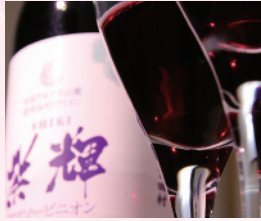
信州宮田ワイン繁輝

長野県南部、中央アルプス「駒ヶ岳」の麓の水と緑に恵まれた村です。晴天率が高く、暮らしやすい気候に加え、四季折々の美しい景観が楽しめます。ワインやウイスキー、宮田とうふ、リンゴの特産や蝶アサギマダラの里としても有名です。