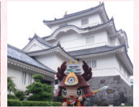
シンボルキャラクター「おたつきー」と大多喜城