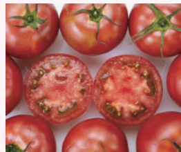
産直野菜(トマト他)