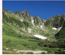
中央アルプス駒ヶ岳