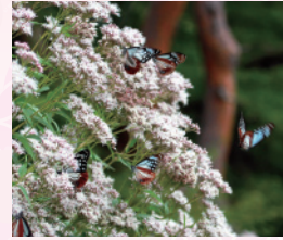
アサギマダラの里