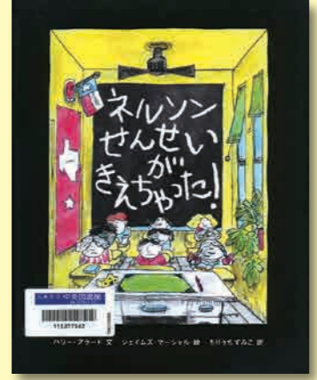
ネルソンせんせいがきえちゃった! ハリー・アラード/文 ジェイムズ・マーシャル/絵 もりうちすみこ/訳 朔北社