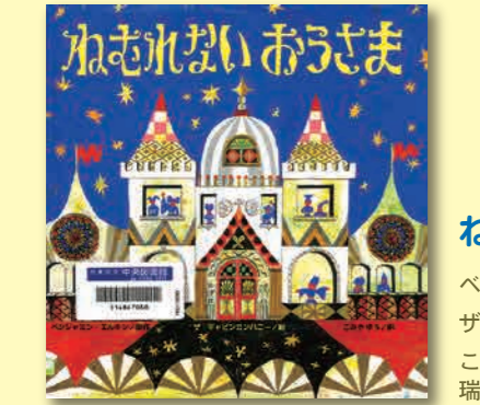
ねむれない おうさま ベンジャミン・エルキン/原作 ザ・キャビンカンパニー/絵 こみやゆう/訳 瑞雲舎