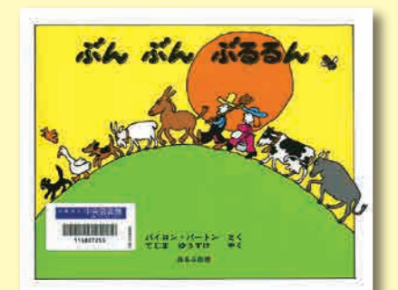
ぶんぶんぶるん パイロン・バートン/さく てじまゆうすけ/やく ほるぷ出版