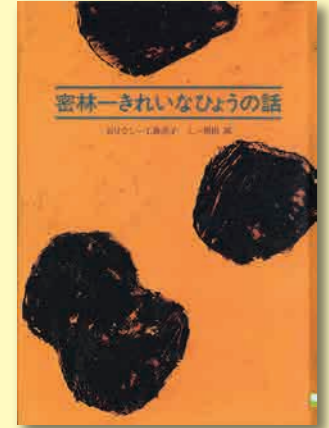
密林一きれいなひょうの話 工藤直子/おはなし 和田誠/え 瑞雲舎