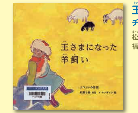
王さまになった羊飼いの羊飼いの話 松瀬七織/再話 イ ヨンギョン/絵 福音館書店