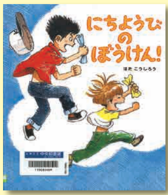
にちようびのぼうけん! はたこうしろう/作 ほるぷ出版