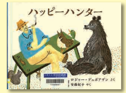
ハッピーハンター ロジャー・デュボアザン/さく 安藤紀子/やく ロクリン社