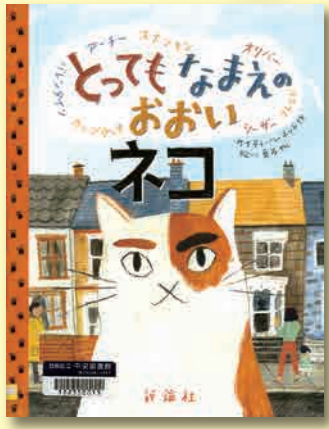
ととても なまえのおおいネコ ケイティ・ハーネット/作 松川真弓/やく 評論社