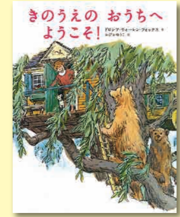
きのうえのおうちへようこそ! ドロシア・ウォーレン・フォックス/作 おびかゆうこ/訳 偕成社